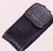
キャリングケース