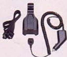
シガーライターケーブル (ホルダー付)