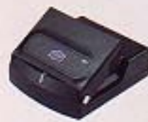
急速携帯チャージャーE (ACケーブル付)

注意 正しく安全にお使いいただくため、ご使用前に必ず「取扱説明書」と「安全上のご注意」をよくお読みください。