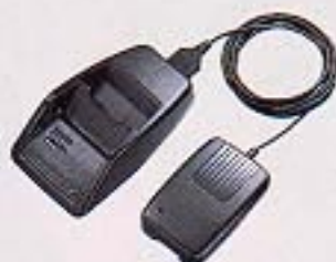
ACアダプター + チャージアダプター-E