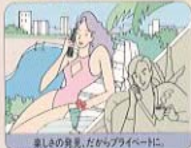
楽しさの発見、だからプライベートに。

連絡設備がない現場仕事でも、これ一台でオフィスから現場、現場からオフィスへとスムーズな連絡がとれます。