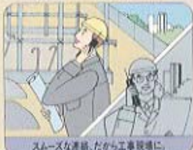
スムーズな連絡、だから工事現場に。

※営業・建設現場・物流センター・不動産業・カーディーラー・農林水産業・テニスコートなど、屋外での仕事にHP-111。さっさと、手放しません。