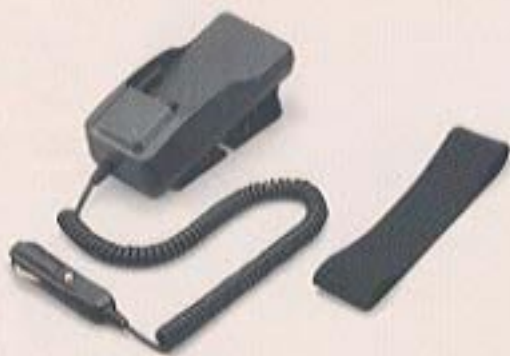
急速シガーライターチャージャー (12V、24Vともご利用いただけます。)