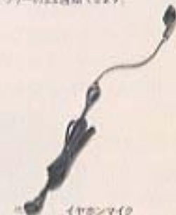
※写真はイメージのみです。

高性能イヤホンとマイクがコード上で一体化されたイヤホンマイクを体せば、ハンズフリーのまは通話できます。