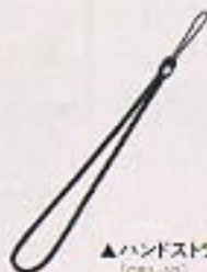
▲ハンドストラップ [CB1-10]