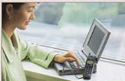
※充電時は充電ケーブルを接続してください。(※日本発祥)

パソコンやFAXなどデータ端末との接続時は、端末の操作だけで通信の開始が可能。従来のようにパソコンなどの発信操作前に、携帯電話で相手先に電話をかける必要がなくなりました。