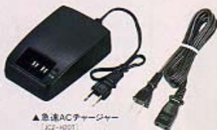
▲急速ACチャージャー [JC2-H007]