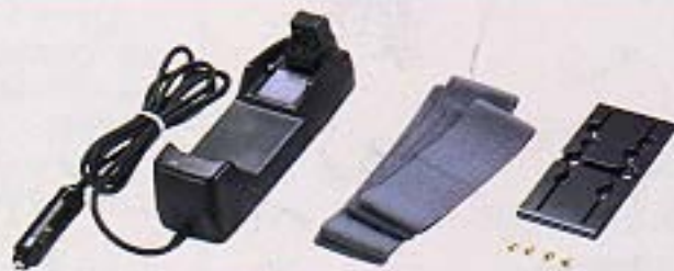
▲車載チャージャー [JC3-H217]