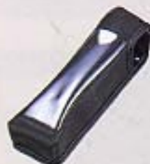
▲キャリングケース [OC1-H201]