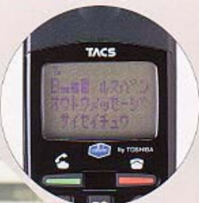
▲メッセージ再生時