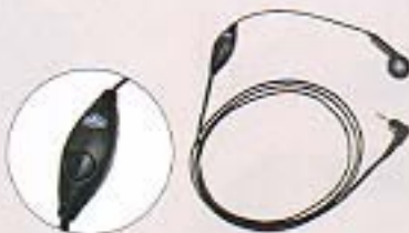
▲スイッチ付イヤホンマイク [EM2-10]