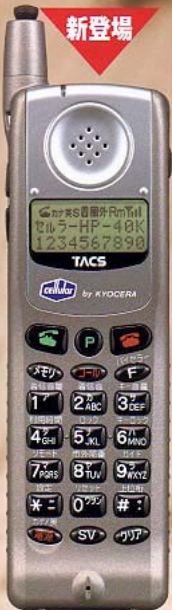
チタンメタリックカラー