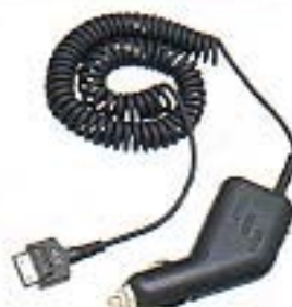
シガーライターケーブル

※セルラー電話会社によっては、アクセサリキットの構成が異なる場合があります。又、取り扱っていないオプション品もあります。詳細は各セルラー電話会社へお問い合わせ下さい。