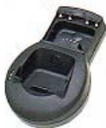
チャージアダプター