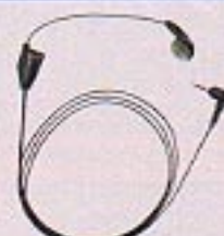
スイッチ付イヤホンマイク (EM3-10)