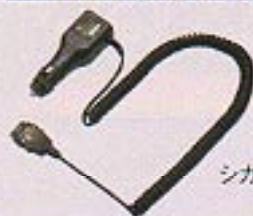
シガーライターケーブル (KL1-D60DE)