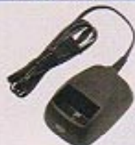
急速ACチャージャー (JC2-D210DE)