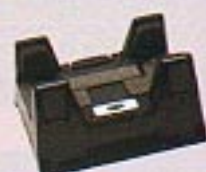
カーホルダー (TM2-10) ※取付ペナシも同梱されています。

●セルラー電話会社により、取扱いのないオプション品もあります。詳細は、各セルラー電話会社へお問い合わせください。