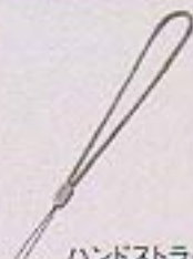
ハンドストラップ (CB2-10)