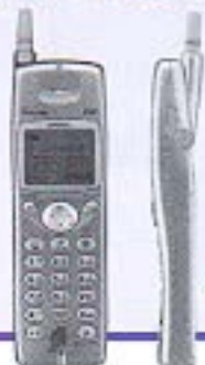
写真には電池パックS P003 付属のものが付きます。