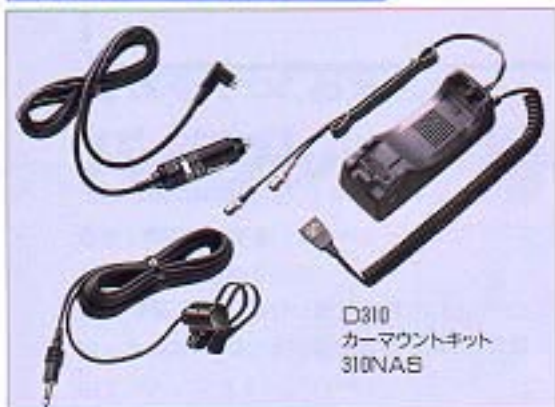
D310 カーマウントキット 310NAS