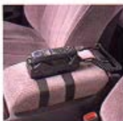
D310カーマウントキット 設置例