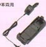
急速充電カーホルダ(312PPS)