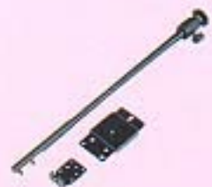
フレキシブルスタンド(030YHB)