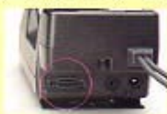
データ通信インターフェイスコネクタ(16芯)

D312は、本体にはもちろん、カーマウントキットにもデータ通信インターフェイスコネクタ(16芯)を内蔵。D312をカーマウントキットに装着したままで、より手軽にノート型パソコンや携帯型ファクシミリなどと接続できます。また日本電装の「MIUT」と接続することで、「MIUT情報サービス」にも対応、今までとは違う新しいドライビングスタイルを生み出します。