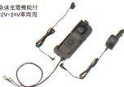
カーマウントキット(312NAS)