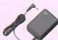
急速充電ACアダプタ(309PQB)