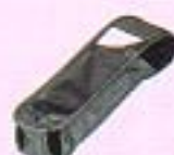
キャリングケース(312FCB)