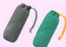
ミニモバケー グレー(901FCB) グリーン(902FCB)