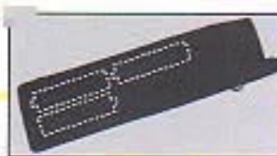
●単3アルカリ乾電池使用時

外出先で、万一電池パックが切れた場合でも、乾電池で対応できるので安心して電池パックをはずして、市販の単3アルカリ乾電池3本を入れるだけで、約60分程度の連続通話が可能です。