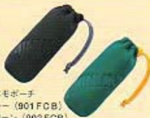
ミニモモチ ブルー (901FCB) グリーン (902FCB)