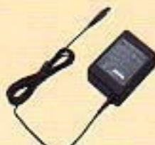
急速充電ACアダプタ (319PQB)