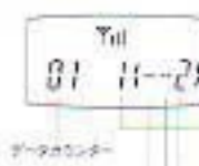
ダイヤルコントロー

※例えば、0.1秒を16分音符とすると、0.2秒音符は32分、0.4秒音符は16分と表現できます。