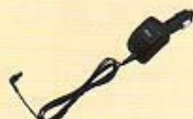
急速充電シガーライターアダプタ (319PER)