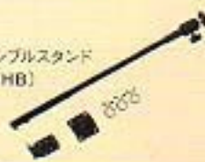
フレキシブルスタンド (030YHB)