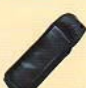
キャリングケース (319FCB)