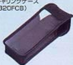
●キャリングケース (320FCB)