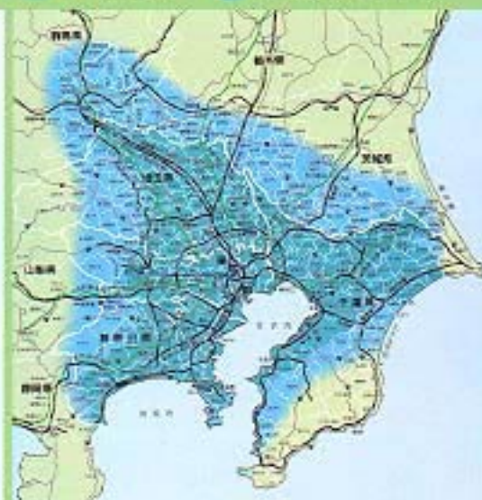
おおよそ使用できるエリア

*サービスエリア内であっても、地下鉄、地下室、地下駐車場、山間部などでは受信できない場合があります。