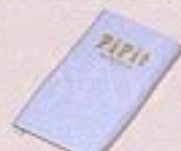
電池パック (539ULB) ※裏面のみ「PiP」ロゴ オーナメントがつけられています。