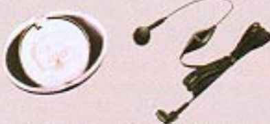
スイッチ付イヤホンマイク (901QEB)