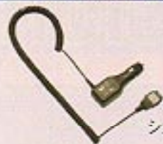
急速充電 シガーライターアダプタ (509PEB)