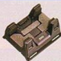
カーホルダー (C007GAB) ※車種・ベルトも同様されています。

●セット品には電話機本体も含まれます。詳しい内容につきましてはIDO総合カタログをご覧ください。