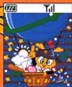
(スカイウェブ起動画面)