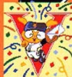
(グリーティング受信画面)