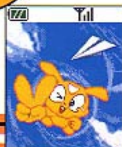
(スカイウォーカー起動画面)