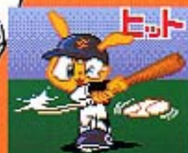
(野球アニメーション・アクション画面)