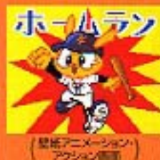
(野球アニメーション・アクション画面)