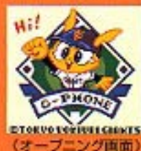
(オープニング画面)