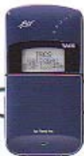
パール・ミッドナイト・ブルー