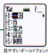
見やすいボールドフォント

クッキリ明るい高品質・大型ディスプレイを搭載。さらに視認性の高いボールド(太文字)フォントなど、見やすい工夫がいっぱいです。