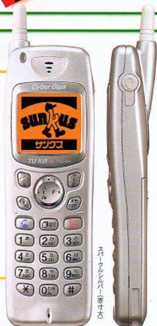
スパークルシルバー(原寸大)